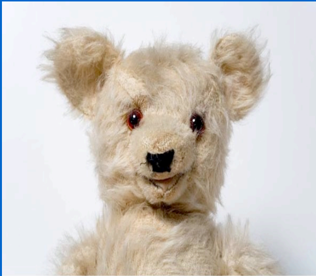
Bild: Imago http://www.t-online.de/eltern/erziehung/id_48506954/die-schmusetuchlobby-welche-rolle-spielen-uebergangsobjekte-.html

Übergangsobjekt: Unentbehrlich, sicherheits-, autonomiefördernd Hilft Objektkonstanz aufzubauen.