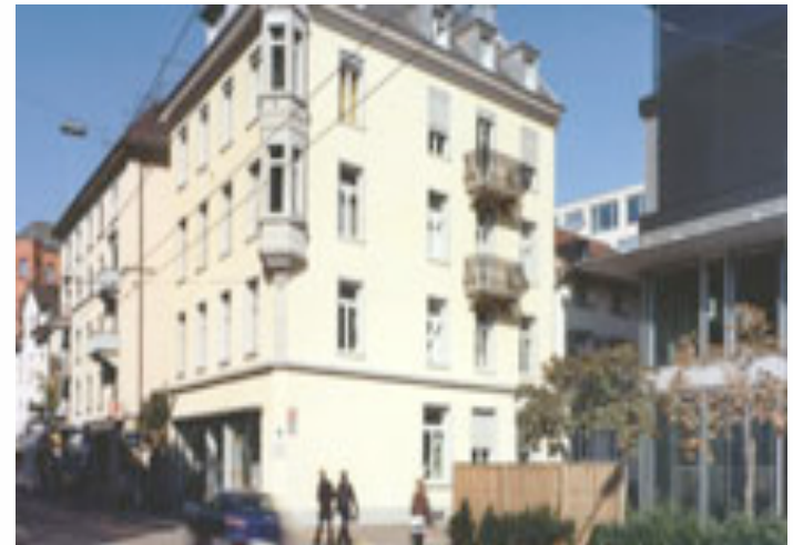
Zentrum für Soziale Psychiatrie, Militärstrasse 8, 8004 Zürich